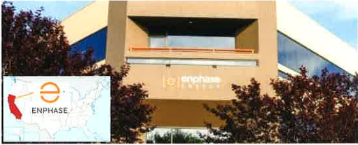
SIÈGE ENPHASE - CALIFORNIE